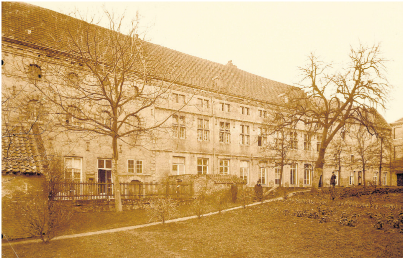
Dit pand aan de Lenculenstraat was van 1690 tot 1912 protestants weeshuis. Tussen 1810 en 1825 maakten de wezen tijdelijk plaats voor de vondelingen. Van 1914 tot 1951 was hier het Provinciaal Museum en van 1951 tot heden de Toneelacademie. Foto van circa 1900.

Vondelingen zijn er altijd geweest. Wanneer ouders hun kinderen niet meer konden onderhouden, gebeurde het wel eens dat ze, tot wanhoop gedreven, een pasgeboren baby te vondeling legden, in de hoop dat iemand zich over de boring zou ontfermen, en hem een toekomst zou gunnen. Natuurlijk mocht niemand weten wie de ouders van de vondeling waren. De vertwijfelde ouders schaamden zich, en bovendien was het strafbaar. Soms bewaarden de ouders een bewijsstuk (bv. de helft van een in tweeën gescheurd voorwerp), om eventueel, wanneer het hun beter ging, hun te vondeling gelegde kind weer op te kunnen eisen.