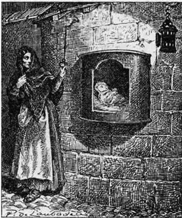
Een wanhopige moeder deponereert haar kind in de rol van een vondelingenhuis en belt aan.

Die naam kon worden afgeleid van de vondestomstandigheden. Soms werd er op de vondeling een briefje aangetroffen met zijn naam, overigens opmerkelijk veel Franstalig, dus afkomstig uit het nabije Wallonië. Zo werd op 18 mei 1819 een jongetje gedeponereerd, met een briefje waarop stond: 'il est baptisé jospé' (hij is gedoopt als Jozef). Joseph werd dus de voornaam, maar omdat de vondeling een stukje wit satijn droeg kreeg hij de familienaam Satijn. De