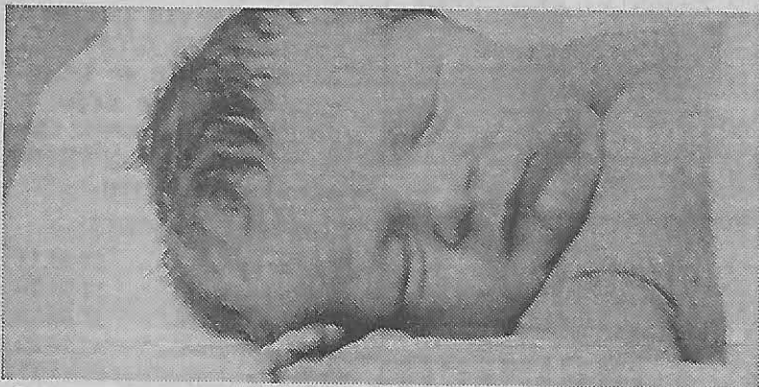
Otto van Meppelen, zoals hij na zijn vondst in maart 1971 in de couveuse in het ziekenhuis lag.