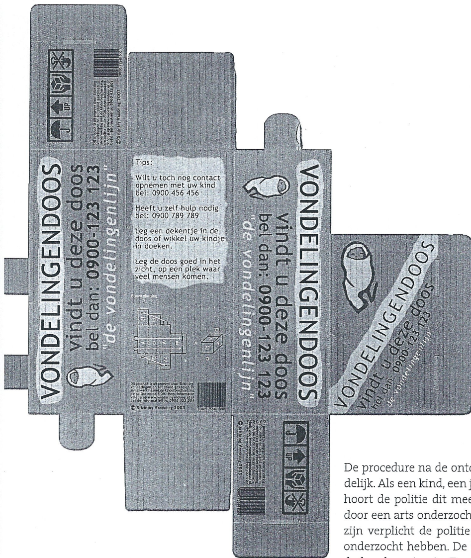
ILLUSTRATIE: JOSEFIEN VERSTERG

'Tussen mijn 12e en mijn 18e was ik soms heel verdrietig. Ik wist niet waar ik bij hoorde'