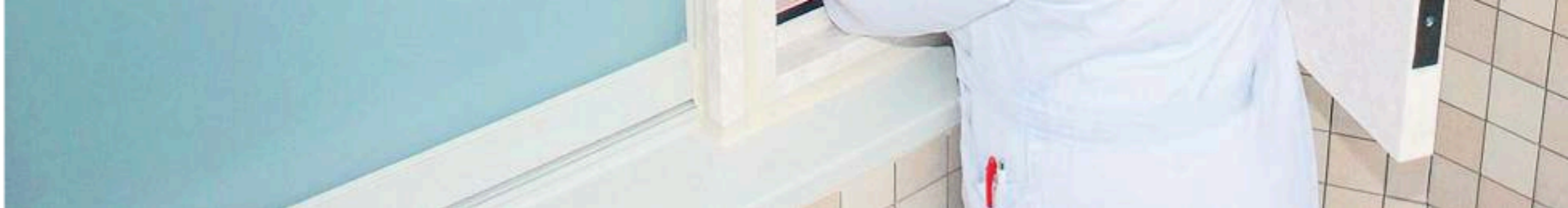
In 2007 werd in Japan een vondelingenluik geopend.